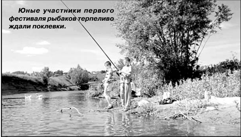
Юные участники первого фестиваля рыбаков терпеливо ждали поклевки.