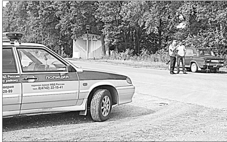
В ходе рейда инспекторы ГИБДД выявили и другие нарушения ПДД: несоблюдение правил обгона, скоростного режима и т. п.

Специальные рейды, цель которых — выявление водителей, управляющих транспортными средствами