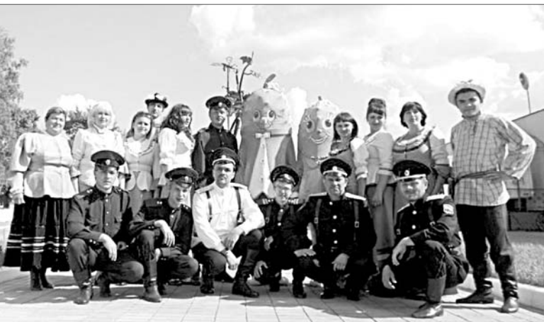
Ансамбли «Русь» и «Росстань» в гостях у черкасцев.