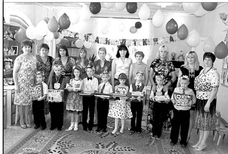
Выпускники детского сада «Тополек».

Поздравить маленьких выпускников приехали представители сельской администрации и отдела образования. Гости пожелали будущим первоклашкам быть прилежными учениками и вручили подарки.