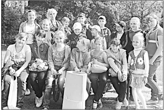
Веселые конкурсы, походы с друзьями — отдых замечательный.