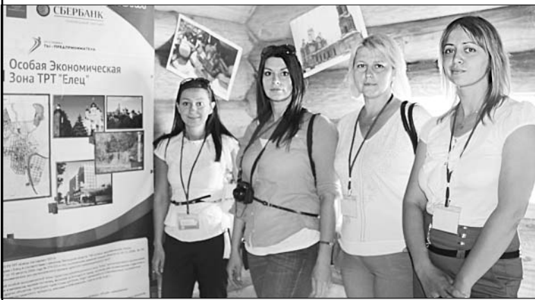
Делегаты форума от Елецкого района.

Молодых предпринимателей приветствовал заместитель главы региона Александр Никонов. Он отметил, что наша область располагается в центре России, богата дорогами, реками, уникальными историческими местами, где непременно хотелось бы побывать. Участникам форума и представилась такая возможность: они посетили замечательное место — сафари-парк.