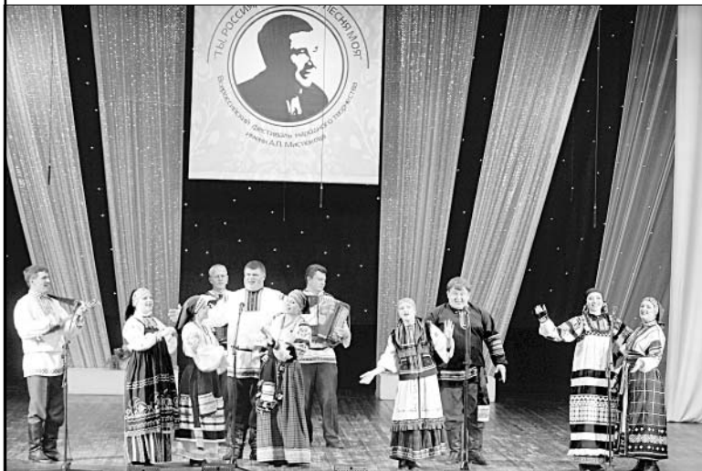
Елецкие артисты на фестивальной сцене.

Отделом культуры и специалистами межпоселенческого центра было организовано этнографическое подворье. В парке Победы г. Липецка раз-