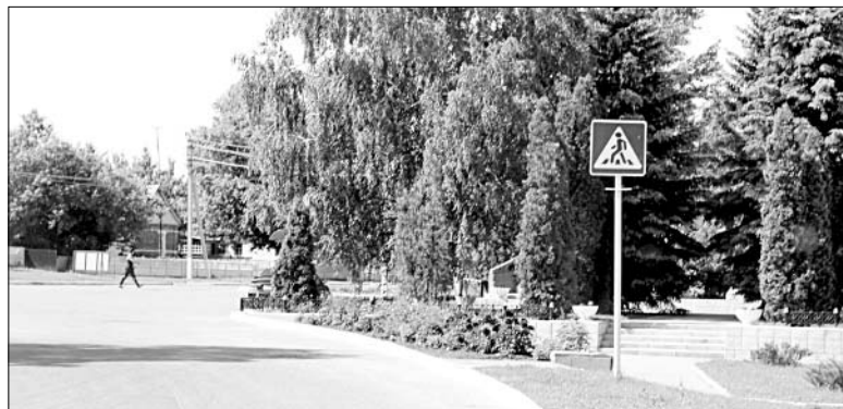
Улицы с. Черкасы — самые благоустроенные.

туризму, другим видам спорта. Нынешним летом в Центре впервые распахнет двери районный школьный лагерь.