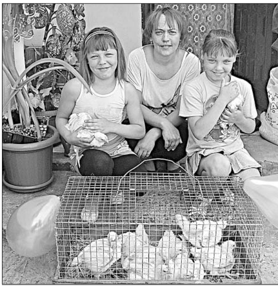
Седристые с пернатым пополнением.