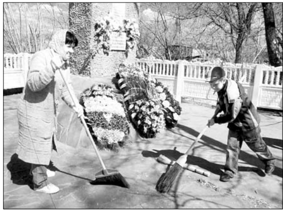
Педагоги и ученики Лавской школы стараются поддерживать чистоту и порядок в родном селе.