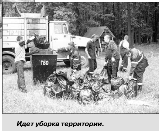
Идет уборка территории.

ки. Это напоминание того, как люди могут «отдыхать». Обидно, что такие живописные места, куда на выходные стекается немало жителей ближайших населенных пунктов,