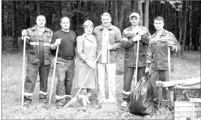
Коллектив ООО «Газпром трансгаз Москва» филиала Елецкое ЛПУМГ на субботнике.