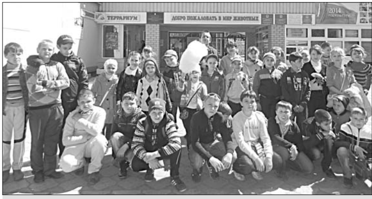
Фотография на память.