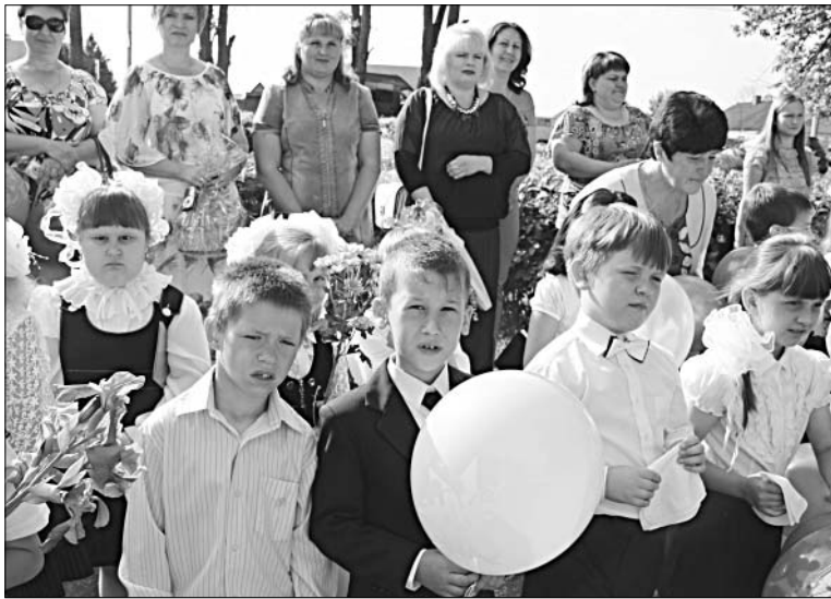
Первоклашки подготовили свои поздравления выпускникам.