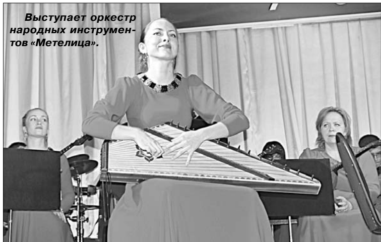
Выступает оркестр народных инструментов «Метелица».