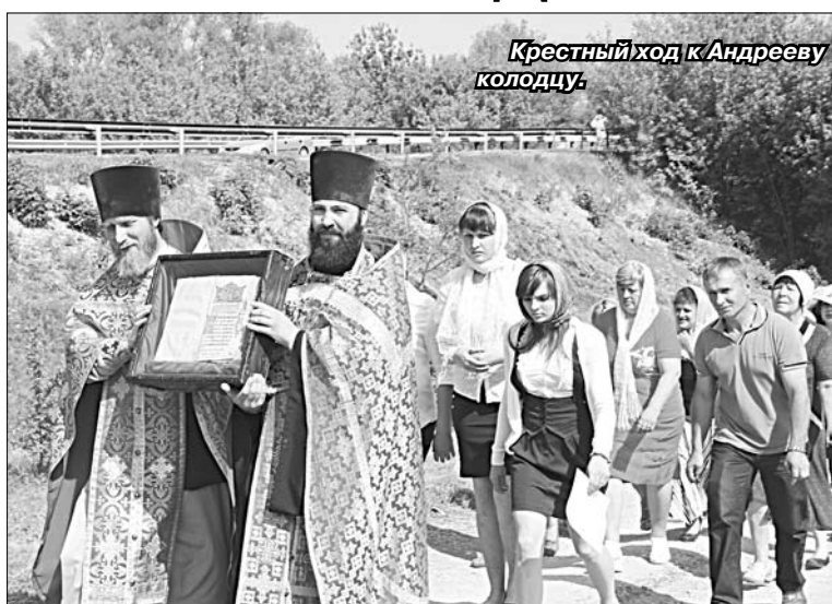
Крестный ход к Андрееву колодцу.