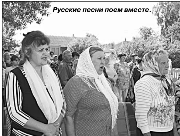
Русские песни поем вместе.