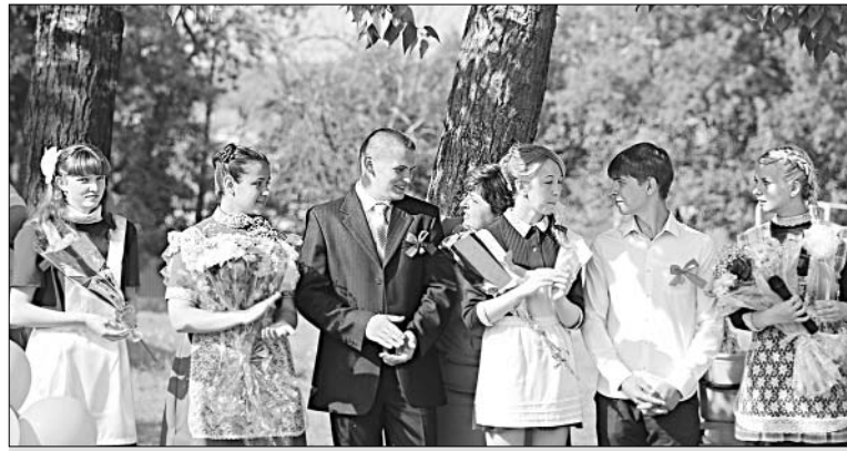
Выпускники школы № 2 с. Казаки на торжественной линейке.

который поможет построить дом в жизни, который вы обязательно наполните теплом, любовью, добротой, — заметил он.