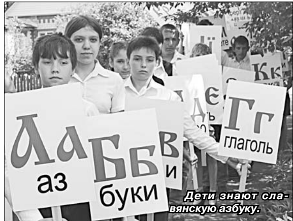
Дети знают славянскую азбуку.

первые годы после Смуты, вначале царствования Романовых. Царь Михаил Федорович за особые заслуги пожаловал Казанской церкви именное Евангелие. Об этом свидетельствует надпись на ней, дошедшая до наших дней: «Р. М. З. 1637 апреля 2 дня Государь Великий Князь Михайло Федорович всяя Руси пожаловал сие святое Евангелие в талицкую Острожескую церковь Пречистые Богородице Казанские». Евангелие хранится в краеведческом музее города Ельца.