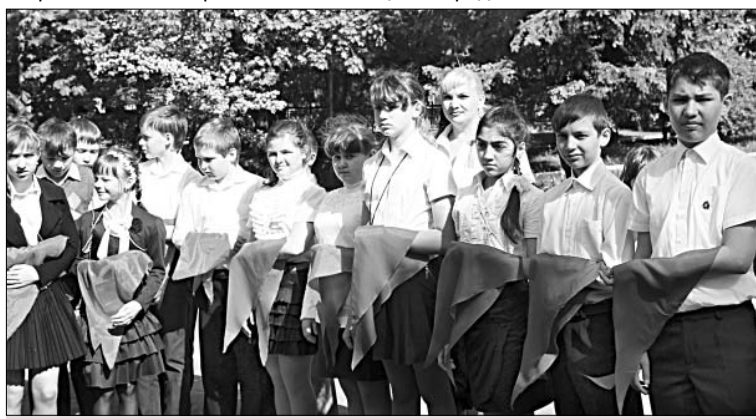
«Будь готов! Всегда готов!»