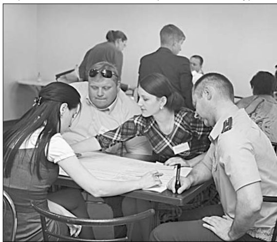
Делегация Молодежного парламента Елецкого района.

Подобная встреча прошла на высоком организационном уровне,