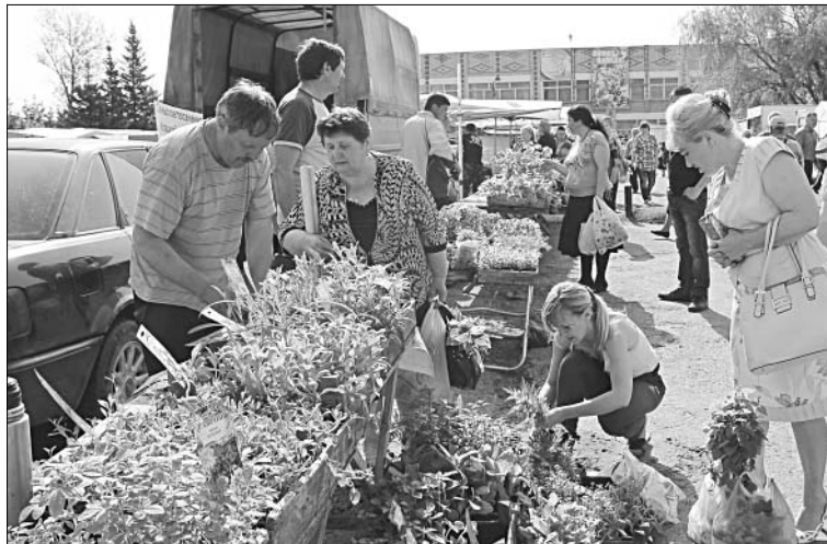
Рассада цветов на любой вкус.

группой товаров, и возможностью того, что сельчане могут свободно