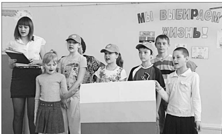
Выступление агитбригады «Пульс».

Всех присутствующих приветствовала агитбригада «Пульс». Их девиз достоин внимания: «Здоровью — да! Болезням — нет! В этом жизни счастливой секрет!». В своем выступлении ребята показали, что им небезразлично будущее страны. Они наглядно продемонстрировали, как пагубно влияет употребление наркотиков, алкоголя и никотина на здоровье человека и продолжительность его жизни. Участники агитбригады четко сформулировали свою позицию. Сегодня пьянство и курение, употребление наркотических веществ — это доказательство слабости и невежества человека. И каждый сам должен сделать вы-