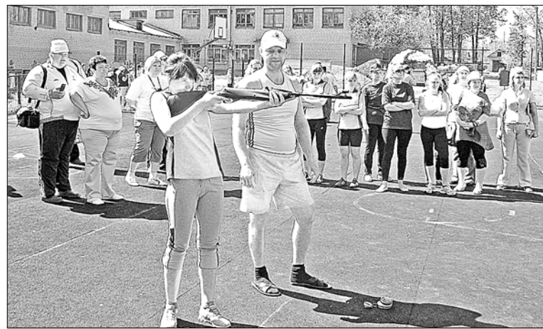
Свою меткость участницы проверили на этапе «Стрельба». На старте — команда Архангельского поселения.