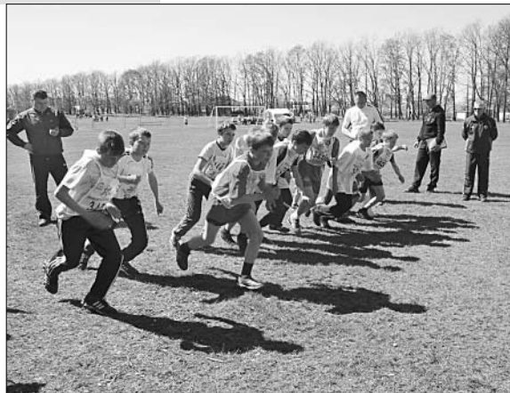
Дистанцию осилит бегущий.

Наград удостоены и те, кто показал лучшие результаты в личном зачете. В