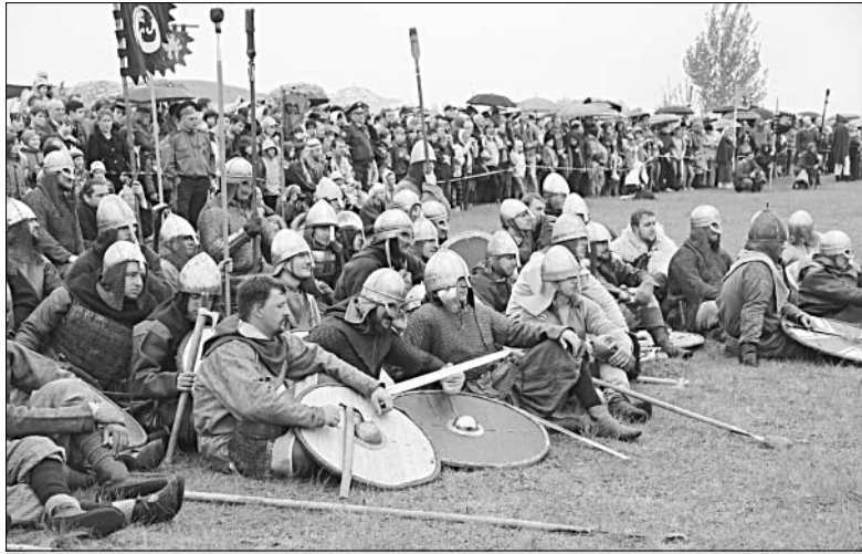
Короткий отдых перед «битвой».

И тем, кто не может обходиться без городских удобств, кипяченой воды и теплой постели, там не место. Здесь идет закалка духа, характера и тела.