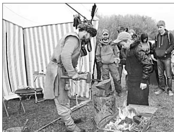
Обучение кузнечному ремеслу.