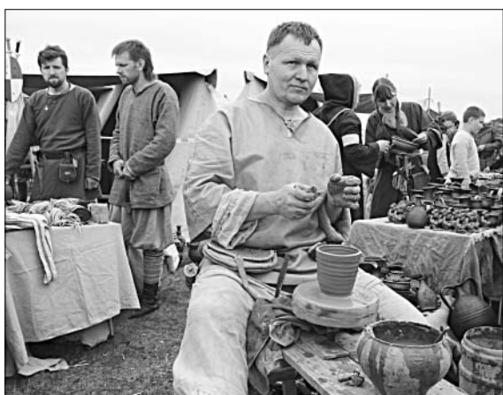
Мастер гончарного дела.