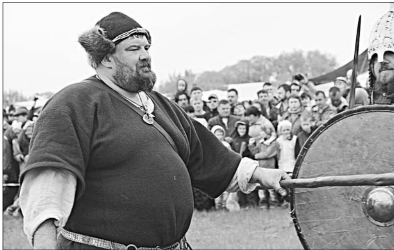
Головной убор, одежда — все удобно как для мирной жизни, так и военной.

Никто не остался без еды — было развернуто более тридцати точек питания. Никто не ушел без сувениров, приятных впечатлений