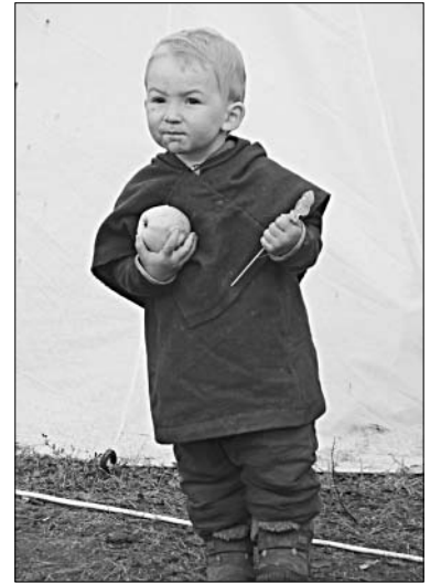
Юный участник фестиваля.

«Русборга». На районном Координационном совете по проведению фестиваля оперативно решались все возникающие вопросы. Силами районной администрации было сгрейдировано и отсыпано дорожное полотно, подготовлены площадки для парковки автомобилей, лагерь обеспечен питьевой водой, дровами, соломой, оборудованы места общего пользования. И даже провели санитарную обработку местности от клещей. Безукоризненно несли службу работники правопорядка.