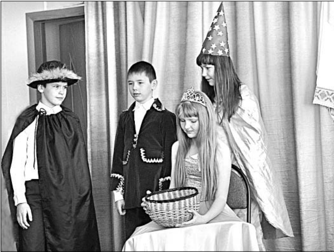
Участники театрализованной сказки.

Участники нашей театральной студии «Данко» решили подарить воспитанникам местного детского сада сказку. После нескольких репетиций отправились в гости к малышам.