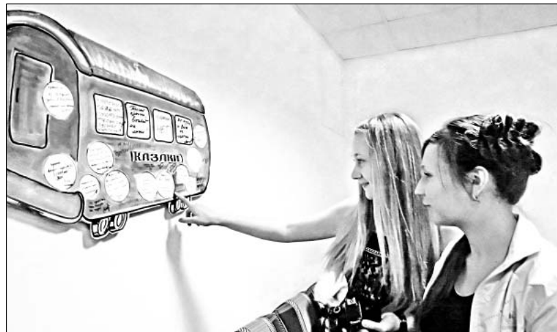
Необычный плакат привлекает внимание молодежи.

выполнения работ по аттестации, на основании договора гражданско-правового характера.