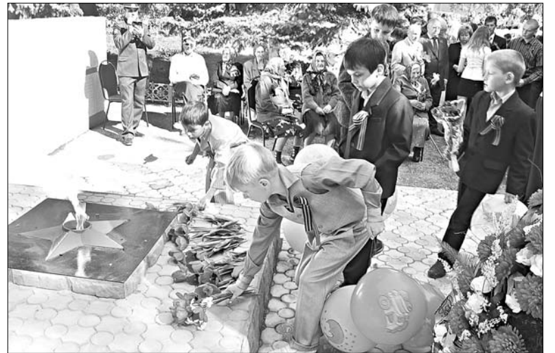
Возложение цветов к Вечному огню.