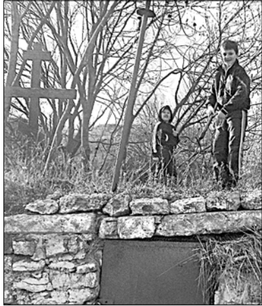
Идет уборка вблизи родника.