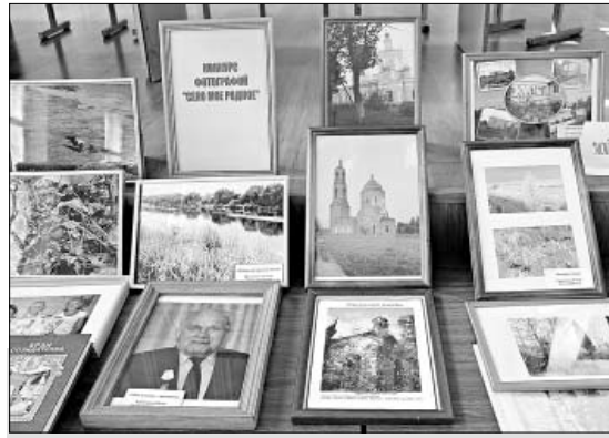
Фотовыставка «Село мое родное».