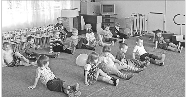
Воспитанники детского сада с. Каменское.