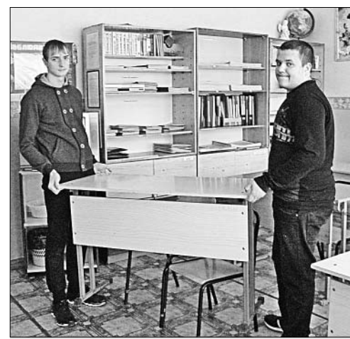
Парням досталась работа посложнее: они отремонтировали класс, расставили мебель по местам.