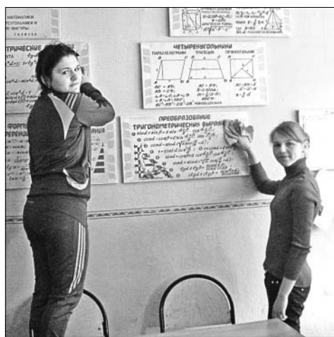
Весенние каникулы учащиеся школы п. Елецкий провели с пользой. Девочки организовали генеральную уборку в классах.