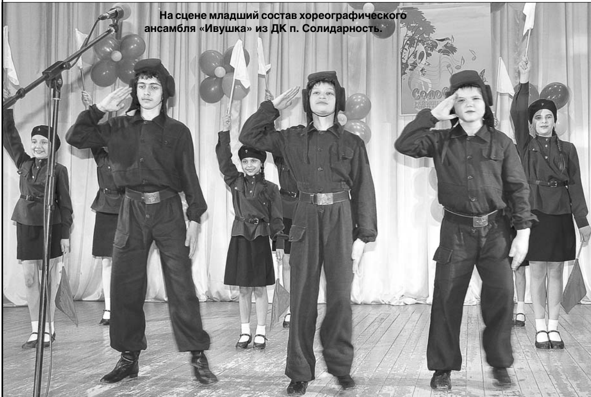
На сцене младший состав хореографического ансамбля «Ивушка» из ДК п. Солидарность.