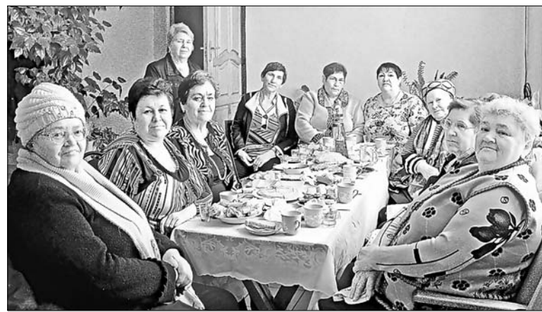
Чаепитие на заседании клуба стало традиционным.