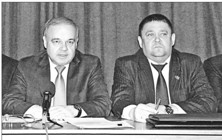
Диалог с главами сельских поселений на семинаре-совещании вели заместители: главы администрации области — Александр Никитин, председателя регионального парламента — Сергей Грибанов.