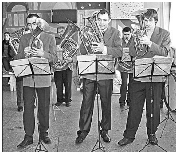
Духовой оркестр с. Казаки.

Многое получается в этом плане у культработников ДК поселка Солидарность, краеведческого клуба «Берегиня» села Черкассы, энтузиастов Дома культуры п. Ключ жизни, села Талица, д.