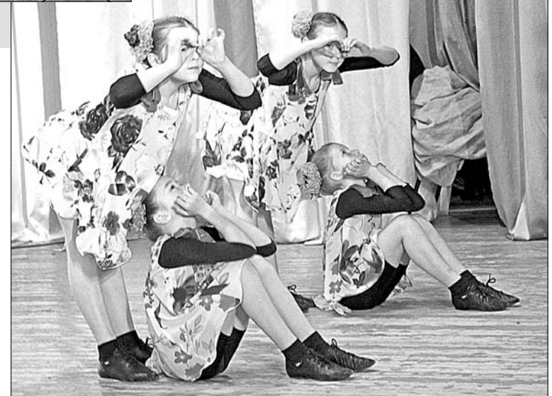
Образцовый ансамбль «Перекресток».