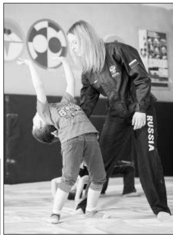
Упражнение на гибкость выполнять несложно.

Остается сказать, что соревнования для детворы организовали их наставники Сергей и Наталья Ларины, спортсмены ДЮСШ. Ребята довольны: с нормативами справились, получили награды, словом, провели время интересно и с пользой.