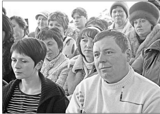
На встречу с главой района собрался актив села.