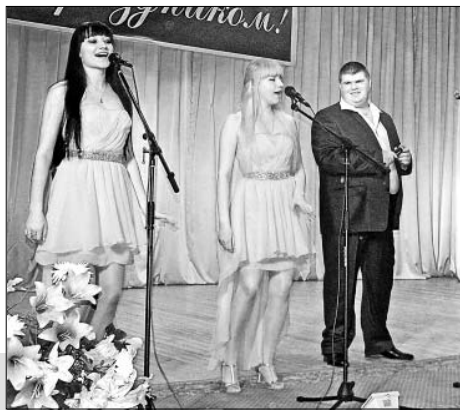
На сцене ансамбль «Млада».