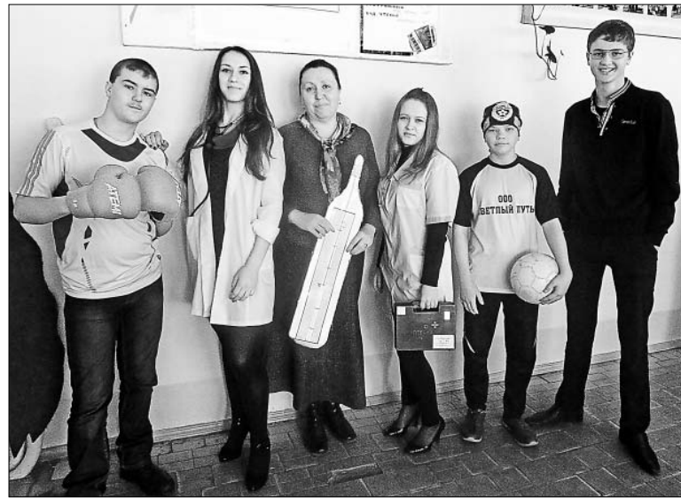
Артисты молодежного театра с. Каменское.