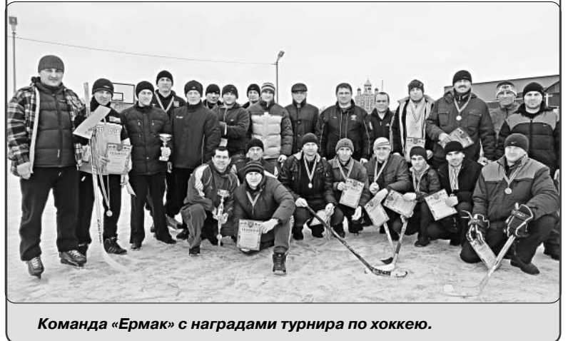
Команда «Ермак» с наградами турнира по хоккею.