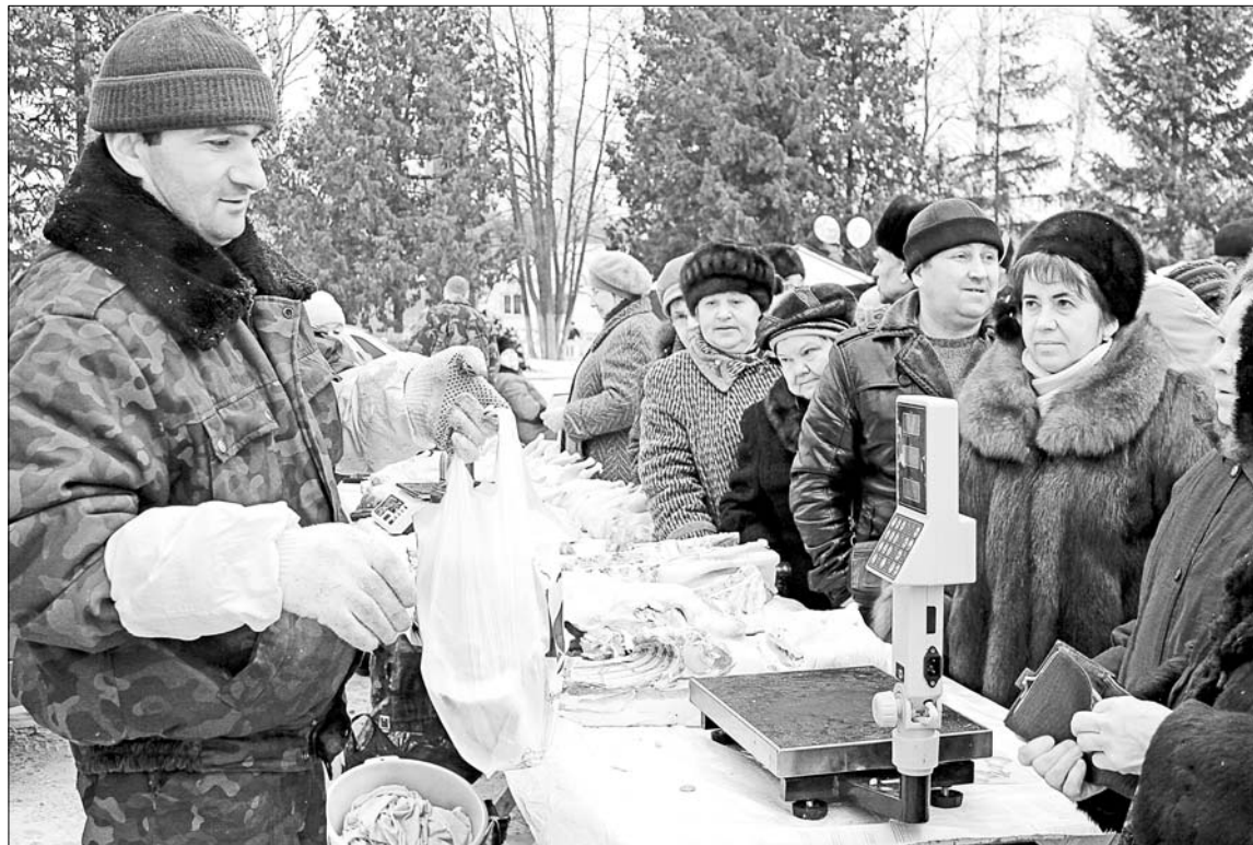
На свежее мясо нашлось много покупателей, даже выстроилась очередь.