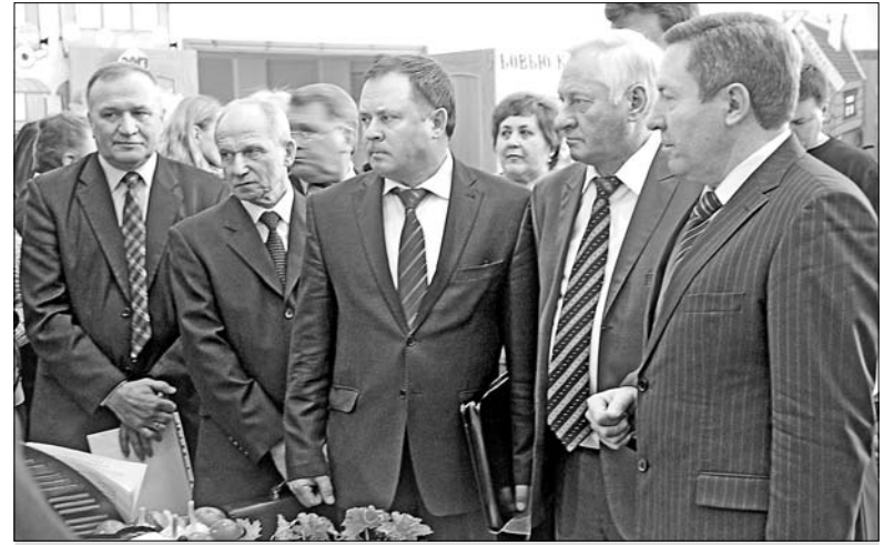
Руководители области и главы администраций знакомятся с экспонатами, представленными на выставках в фойе ДК, где проходил адмсовет.

Качество жизни на селе включает в себя и такой вопрос, как качество предоставления ее жителям коммунальных услуг. Ныне