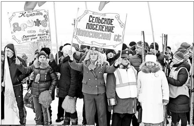
Группа поддержки Колосовского поселения.