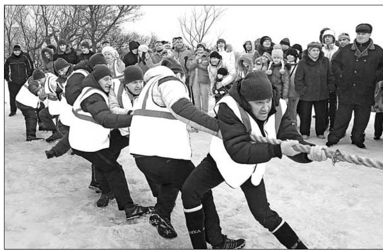
Перетягивание каната — один из самых зрелищных конкурсов.