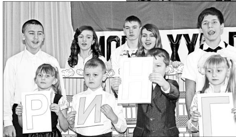
Группа поддержки ДО «Ринг» п. Ключ жизни.