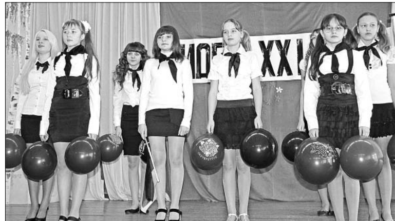
Группа поддержки ДО «Алые паруса» с. Лавы.