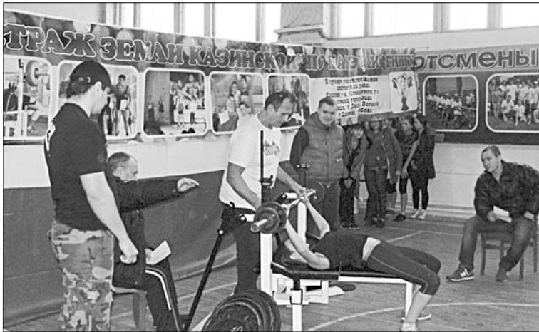
Судейская бригада внимательно следила за выступлением атлетов. Не каждый участник прошел испытание.

за награды вступили более 70 спортсменов.