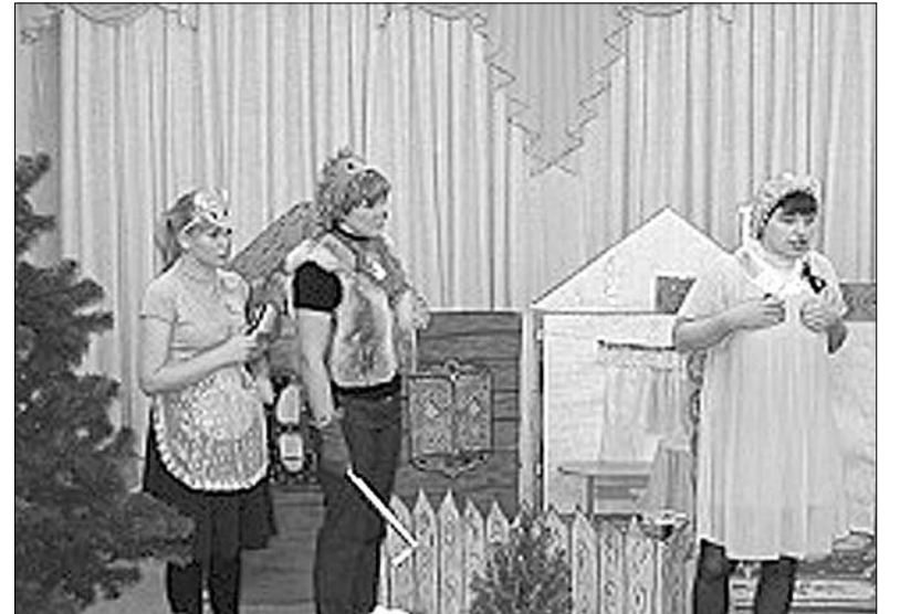
Театрализованное представление с участием воспитателей.

Можно сказать, что театр — это неисчерпаемый источник развития чувств,