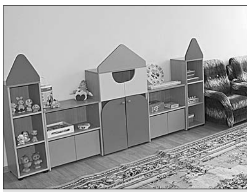
Обновленная игровая комната.

А пока детский звонкий смех раздаётся в просторных группах и смолкает в уютных спальнях. Все здесь сделано, устроено, покрыто, побелено с любовью. Привлекательно выглядят стены, окрашенные в радужные тона. Ребяточки получили необычайно удобные и комфортные туалетные комнаты, раздевалки.