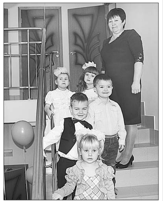
И маленькие хозяева, и педагоги довольны переменами в родном детском саду.