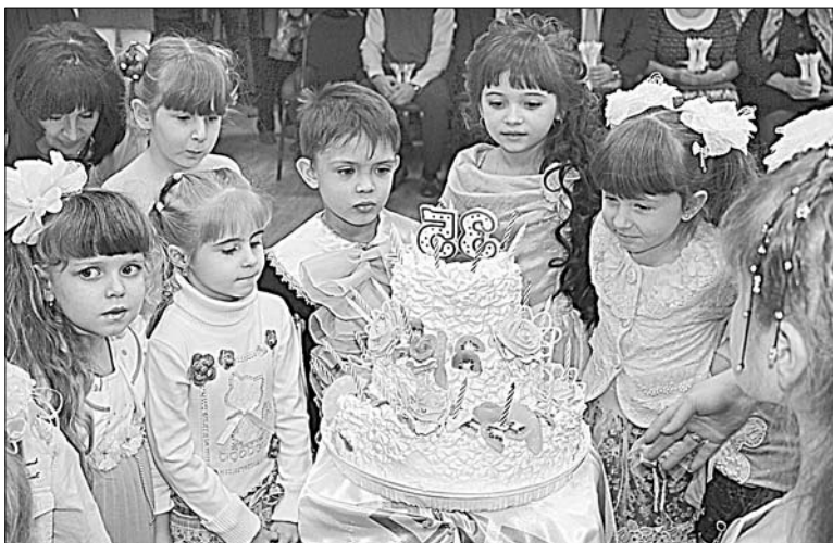
Торт — виновникам торжества.

В поселке Ключ жизни на этой волне распахнул двери реконструированный детсад. Его называли в праздничный день как подарком. Это было действительно так. Более полугодя дети, родители ждали этого события. Но не только. Мамы и папы приближали его как могли — помогали убирать территорию, освобождали от мусора помещение.