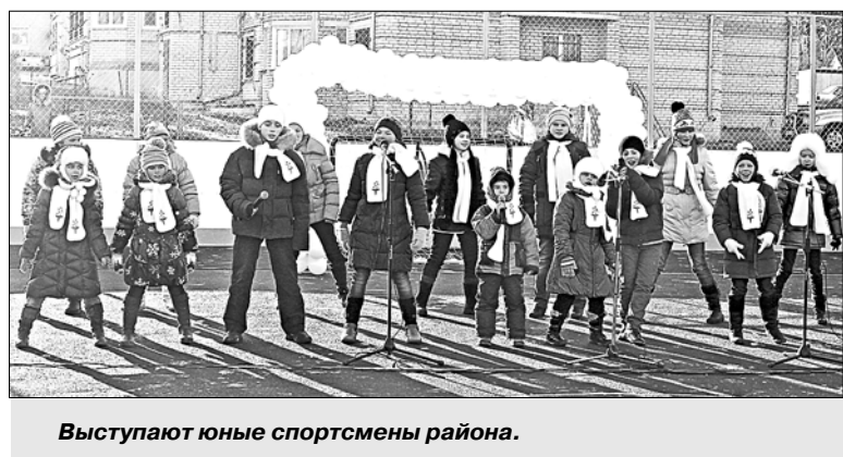
Выступают юные спортсмены района.