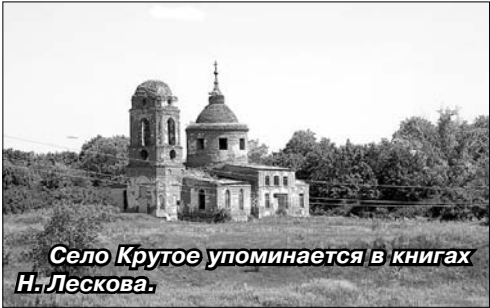
Село Крутое упоминается в книгах Н. Лескова.

стом, где пересекались жизненные дороги ярких людей государства Российского. Они остались в памяти А. С. Пушкина. Именно к ним в своих воспоминаниях обращается Николай Семенович Лесков.