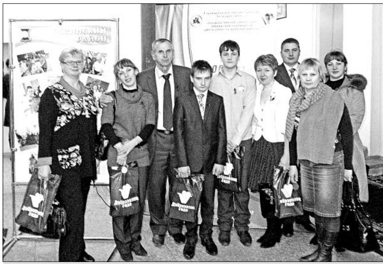
Делегация Елецкого района.

Заметим, что организаторами конкурса выступили Управление внутренней политики Липецкой области и областной Центр развития добровольчества.