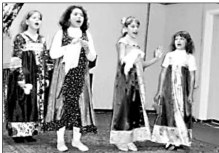
Юные артисты подготовили в подарок для мам концертные номера.