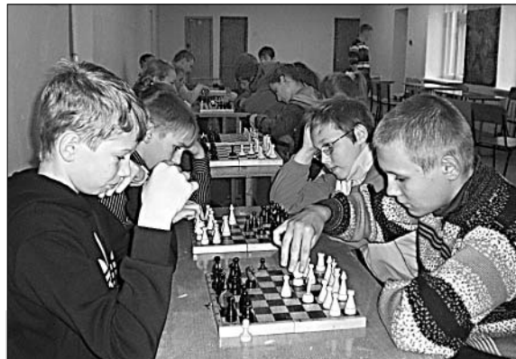
За «золото» районных соревнований боролись команды из Черкассов.

Команды, поднявшиеся на пьедестал, и их участники награждены медалями, грамотами. Победителям вручен кубок от отдела физической культуры, спорта и молодежной политики райадминистрации.