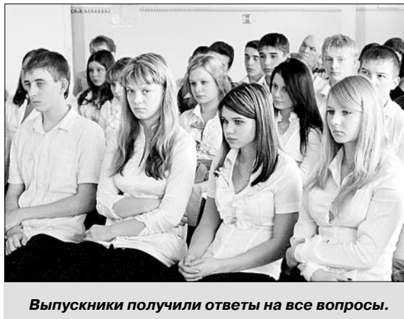
Выпускники получили ответы на все вопросы.