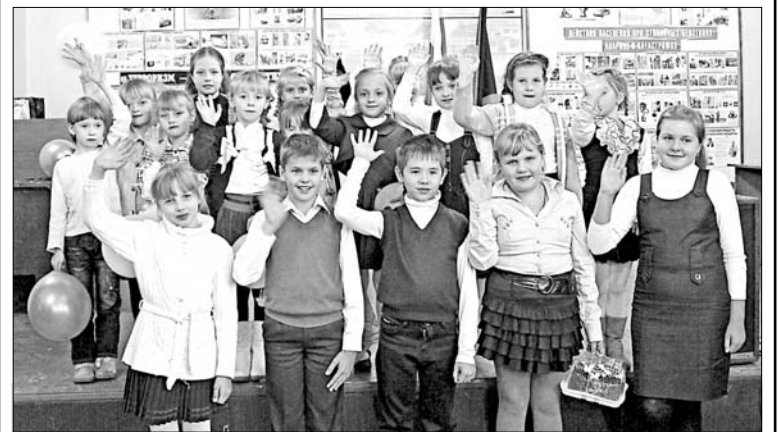
Юные читатели «Елецкого Колобка».