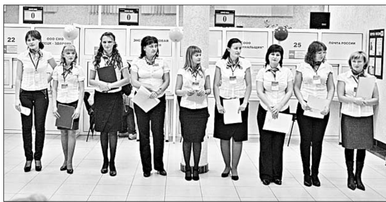
Участницы конкурса «Лучший работник МФЦ».

«Навыки и стандарты общения с клиентами» — так назывался следующий этап состязаний. Участницы словно на экзамене, тянули билеты. Вопросы были с подвохом. К примеру, «звонят по телефону. Ваши действия?». Это