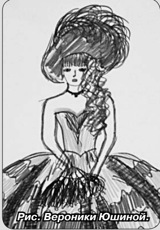
Рис. Вероники Юшиной.

У каждого мама — самая красивая, самая любимая, самая хорошая. На рисунке это передать непросто, но все же мы постарались изобразить мам как можно лучше. А о том, как любим их, скажем словами в день праздника. К этой дате мы обязательно готовим концертные номера, учим стихотворения. Надеемся, что порадуем мам своим творчеством, ведь они наши первые помощники, вместе с нами приходят на занятия в кружки в Дом культуры.