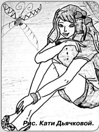
Рис. Кати Дьячковой.