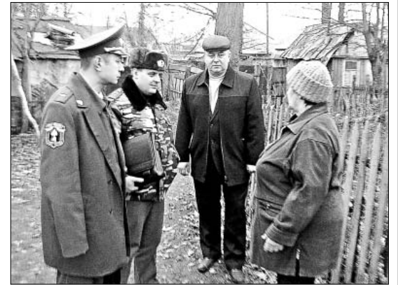
Представители власти ведут разъяснительную работу среди населения п. Ключ жизни.