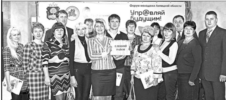
Делегация Елецкого района.