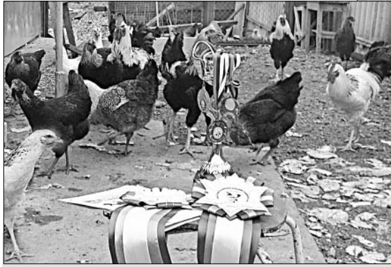
Для кур и петухов награды не важны, главное — кормов и места на подворье в достатке.