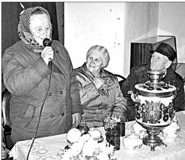
У микрофона — «золотые» юбиляры.