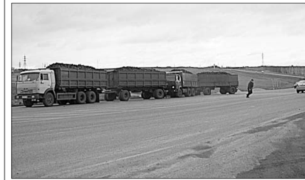
При содействии сотрудников ОГИБДД ОМВД по Елецкому району подготовила А. МИТУСОВА.

Примечательно, что большинство водителей большегрузов после работы садятся за руль собственных авто. И наверняка движутся по тем же дорогам, где спешат машины со свеклой. А значит, должны понимать, сколько неудобств создают другим автомобилистам.