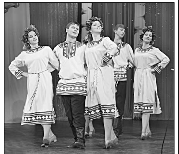
Танцевальный коллектив ДК п. Солидарность «Ивушка».

Завершилась программа авторской песней поэтессы Елецкого