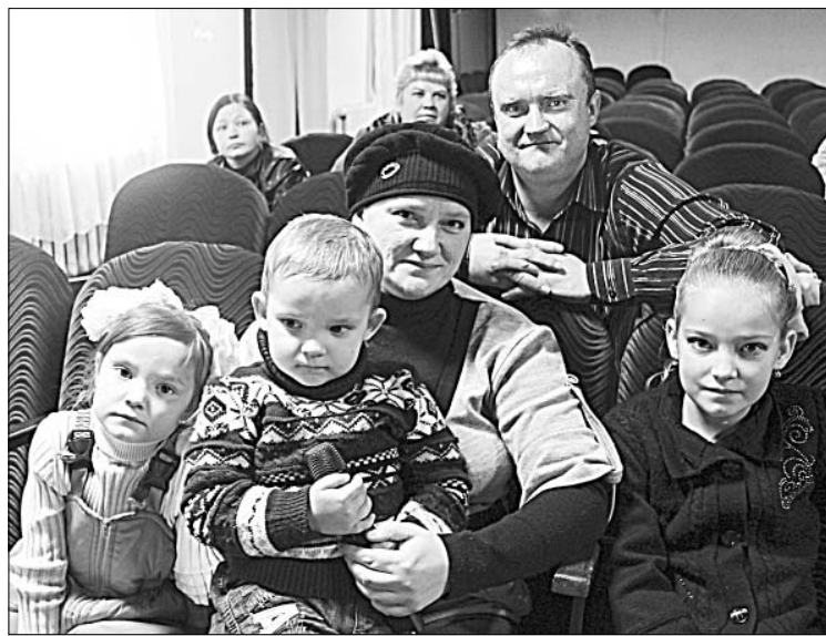
Семья Садовых из Архангельского.

Екатериновцы продемонстрировали свою сплоченность, землячество. Они по-доброму общались, радовались за тех, кого чествовали на празднике, желали друг другу здоровья, достатка.