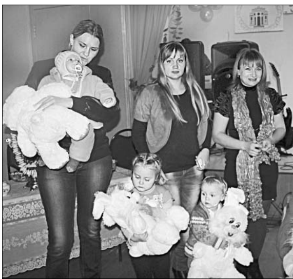
Подарки — юным жителям Екатериновки.

Он подвижный, шаловливый, непоседливый, как все дети. Главная