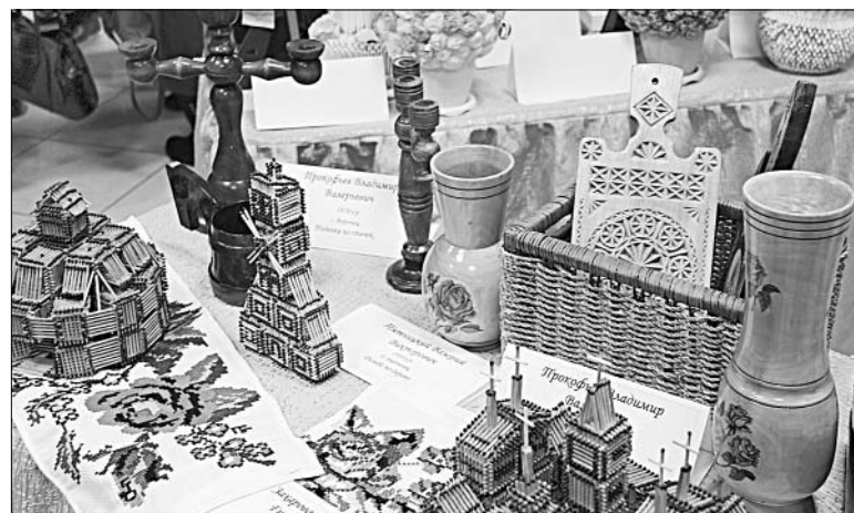
Искусно выполненные из дерева храмы и мельницы елецких мастеров.

В восхищение пришли гости от изготовленных из бисера и бус икон,