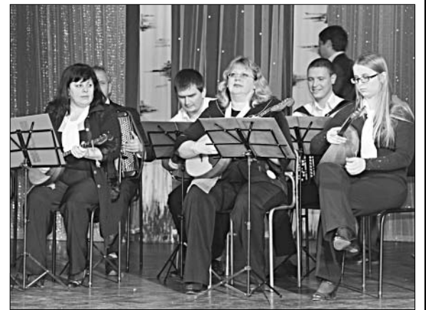
Выступает оркестр народных инструментов.

Как завороченные следят зрители за тем, что происходит на экране. Идет демонстрация заповедных мест района. С ними связано литературное творчество великого Ивана Бунина. Это территория Нижневоргольского по-