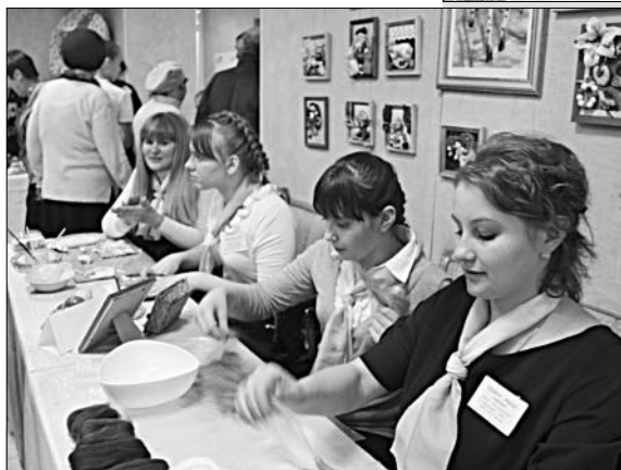
Мастер-класс юных мастериц районного Центра дополнительного образования.