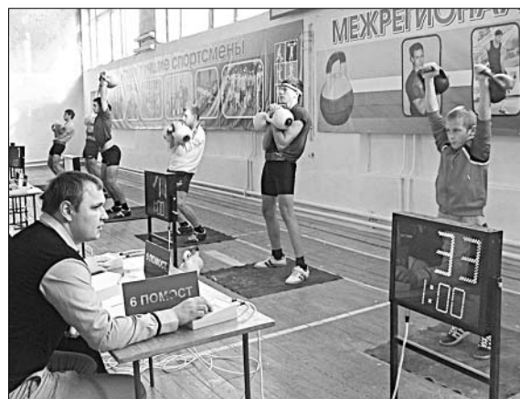
Участники соревновались одновременно на шести помостах.