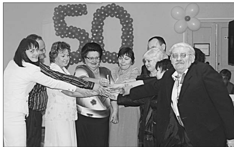
Педагогический коллектив школы зажег свою свечу.