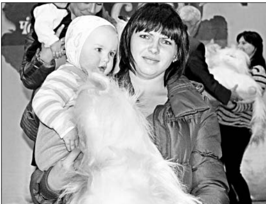
Подарки получили самые маленькие жители села и их родители.