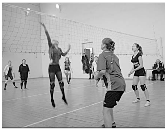
У сетки шла упорная борьба.

рили грамоты и волейбольные мячи, а победителю еще достался и кубок (красивый такой!).