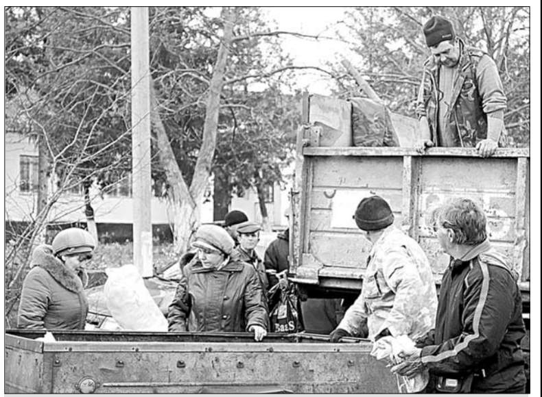
Торговля зерном шла бойко.

На сцене Дома культуры был дан большой концерт. Еще одно событие произошло в этот день в Воронцеком