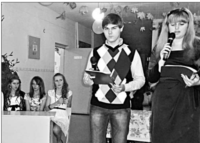
В роли ведущих старшеклассники были очень убедительны. Это отметили педагоги, участники и гости праздника, посвященного осени.

Затем ребята отправились в клуб на концерт. Выступал