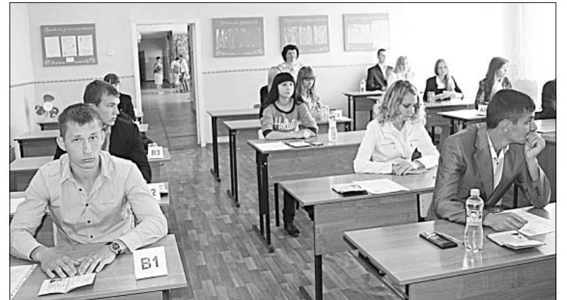
У школьников должны быть нормальные условия для освоения наук.