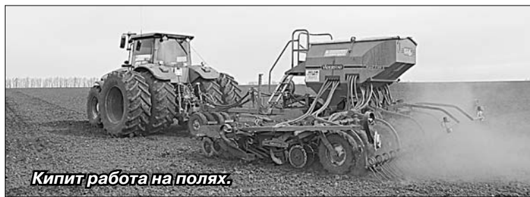
Кипит работа на полях.

Сегодня в полном объеме обмолочены зерновые. Получено 117 тонн зерна при урожайности 35,3 центнера с гектара. Завершена