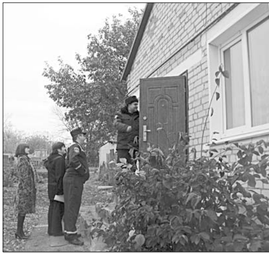
Члены комиссии обходят дома селян.

Не наказывать, а, прежде всего, помочь семьям, оказавшимся в трудной жизненной ситуации, — такова основная цель органов системы профилактики. В поселениях регулярно проводятся рейды, осуществляются проверки тех, кто состоит на профилактическом учете. Но цель визитов специалистов различных служб иногда не просто объяснить людям, которые значатся в списках как, например, родители, ненадлежащим образом исполняющие обязанности по воспитанию своих детей. Встречаются граждане, которые видят в проверках исключительно негативную сторону.