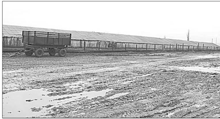
Такая дорога на комплексе «Колос-Агро» вот уже несколько лет.

Когда-то здесь был асфальт, добротная выгульная площадка, цех по приготовлению кормов, уютный дом животноводов.