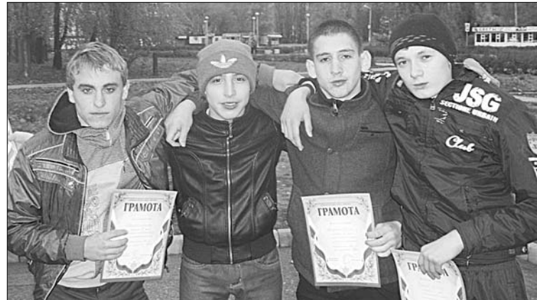
Ельчане с наградами открытого чемпионата по пауэрлифтингу.