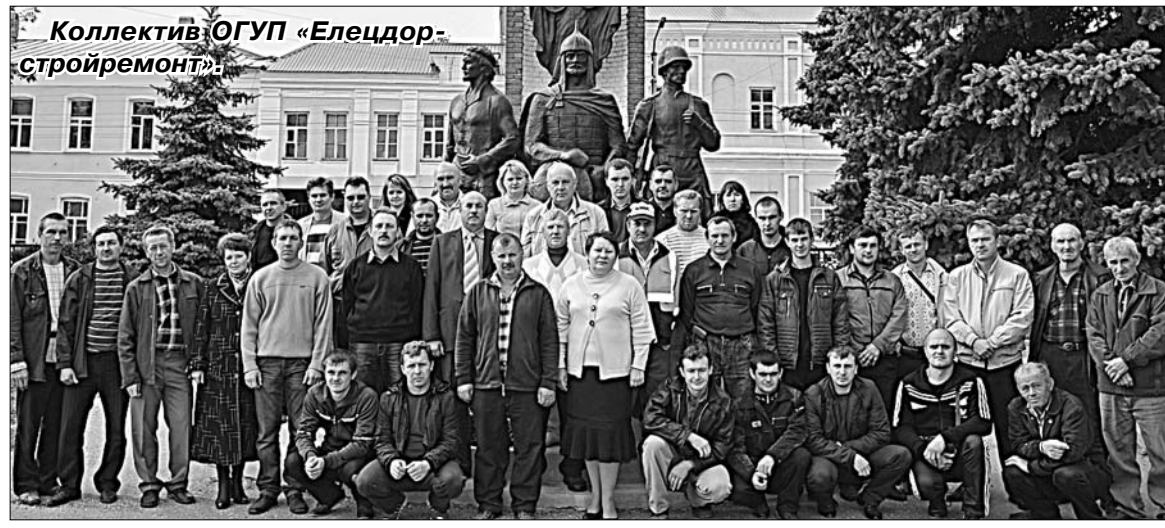
Коллектив ОГУП «Елецдорстройремонт».