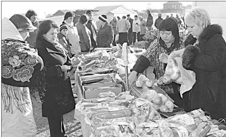
Товар на любой вкус и кошелек.

Передвижной магазин МПК «Луч» предлагал собственную продукцию с маркой «Елецкое подворье», угощал всех горячими беляшами и чаем предприниматель