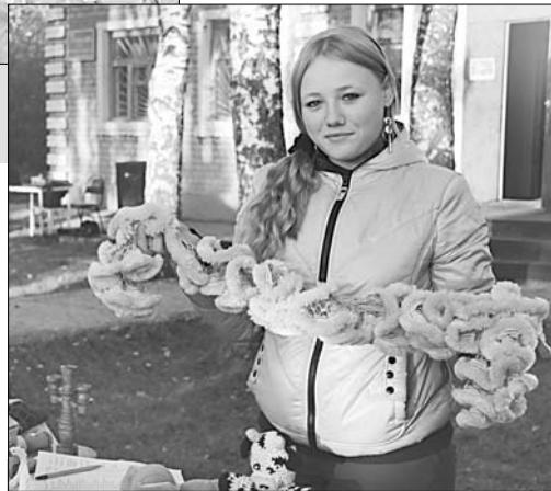
Школьники предлагали товар, сделанный своими руками.

И вот за модными шарфиками выстроилась очередь. А гости, которые приехали на ярмарку, с удовольствием покупали венки местного производства. Голиковские ребята этот промысел освоили давно, и их венки — крепкие, гибкие — уже получили высокую оценку за качество. После ярмарки школьники подсчитали содержимое кошелька: пять тысяч рублей — очень хоро-