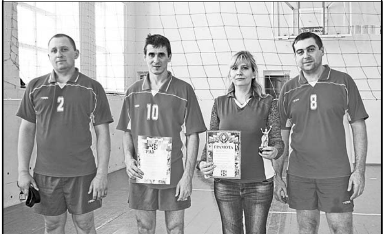
Команда-победительница районных соревнований по волейболу в зачет спартакиады среди педагогов.