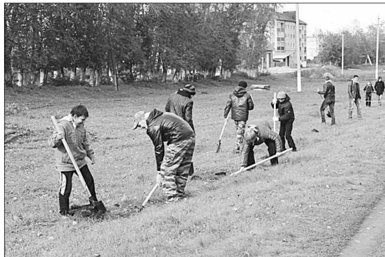
Ребята из добровольческого отряда «Альтаир» смело взялись за посадку аллеи.