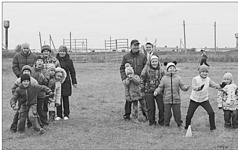
Самые спортивные семьи на старте.