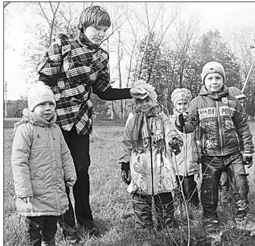
Малыши детского сада п. Солидарность первыми «оставили свой след на планете».