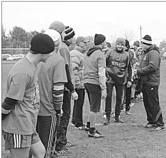
Команды Сокольского и Черкасского поселений.

Стадион п. Солидарность вновь собрал футбольные команды района на очередной матч. Самые сильные станут обладателями кубка закрытия сезона.