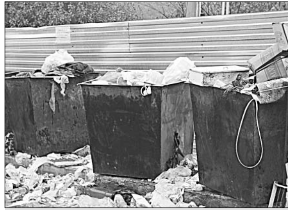
Услуги по вывозу мусора и оплачивать, и оказывать нужно своевременно.

— Мы желаем успехов вашему предприятию. И надеемся, что жите-