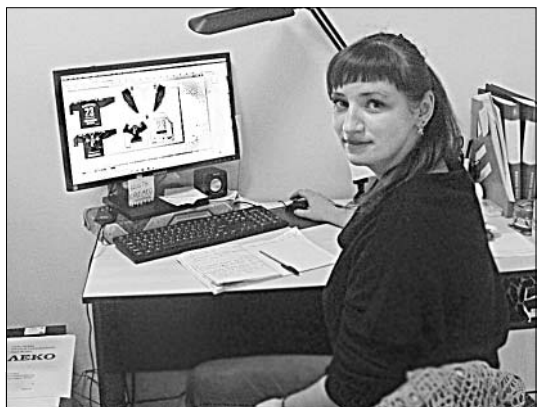
Выполнение заказа начинается с компьютерной «верстки».

ООО «Знак качества» открыто в поселке Солидарность, где и живет сам предприниматель, полгода назад. Производство работает всего три месяца. Потребовалось и время, и изучение технологий, спроса и предложения на этом рынке услуг.