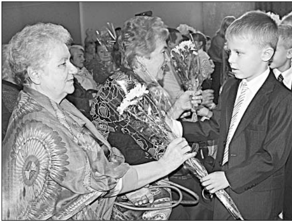
Школьники вручают цветы ветеранам педагогического труда.

На сцене ДК прошла церемония награждения «Золотым звонком» лучших педагогов. Именно школьный звонок является символом детства, беззаботной и счастливой поры. Такую награду получили лучшие из лучших педагогов нашего района в различных номинациях.