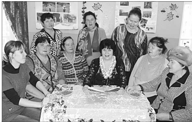
Клуб ветеранов «Воргольские росы».