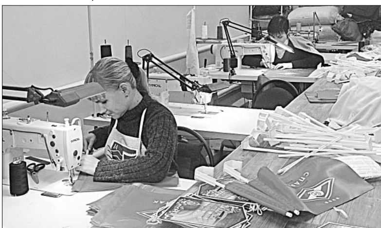
В швейном цехе работа кипит.