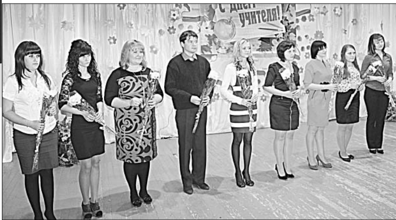
Молодые педагоги — вчерашние выпускники вузов.