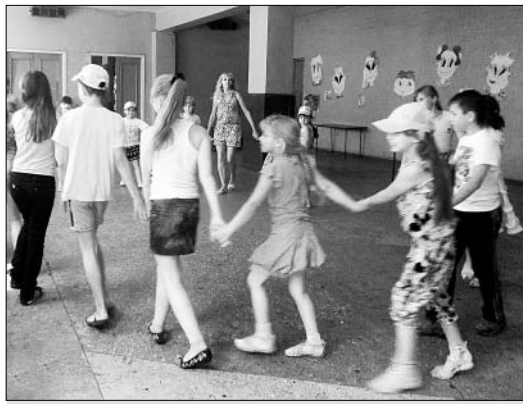
«Станьте, дети, станьте в круг!».

Наши наставники, работники Казинского ДК, такие встречи проводят часто, а мы охотно в них участвуем.