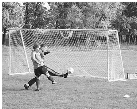
Борьба за мяч была упорной.

Так говорят про футбол. Сколько поклонников у этого вида спорта, наверное, посчитать, невозможно. Даже когда идет борьба за право проведения официальных соревнований, и то страсти разгораются нешуточные. Еще