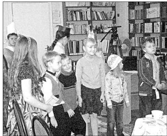
Участвовать в конкурсах интересно.

«День творчества» — так называлась программа для детей и подростков, которую организовали в ДК. Одновременно проводилась запись новичков в кружки художественной самодеятельности. Ребята пели, танцевали, гримировали друг друга, участвовали в творческих конкурсах. Праздник завершился общим дружным хороводом. А еще состоялся традиционный День именинников во всех возрастных группах. Поздравили тех, кто родился летом, подарили подарки. Во время праздничного чаепития играли в любимые игры, показывали миниатюры, танцевали.