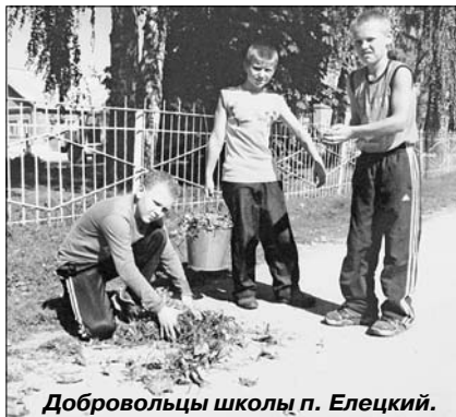
Добровольцы школы п. Елецкий.