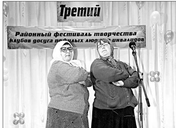
На сцене — «Елецкие соловушки».