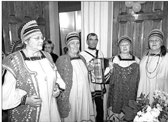
Презентация клуба «Любава» из с. Голиково.