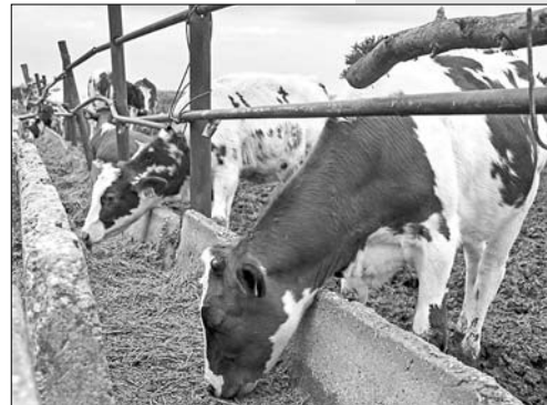
У буренок сочных кормов в достатке.

шлепков, 30 килограммов сена. Вместе с ним трудится практически