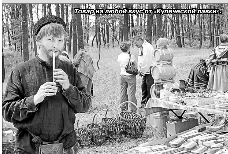
Товарна любой вкус от «Купеческой лавки».

Постоянным партнером многих районных праздников стал магазин народных промыслов «Купеческая лавка», который привозит игрушки, музыкальные инструменты, свистульки, корзины, деревянную посуду. Все это радует детей и взрослых, создает праздничную атмосферу.