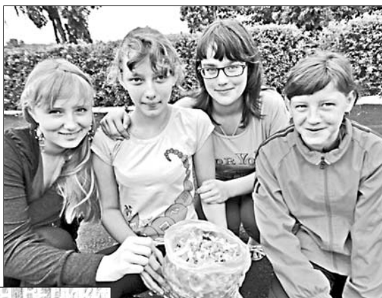
Цветы липы, собранные «Непоседами» для пенсионеров.