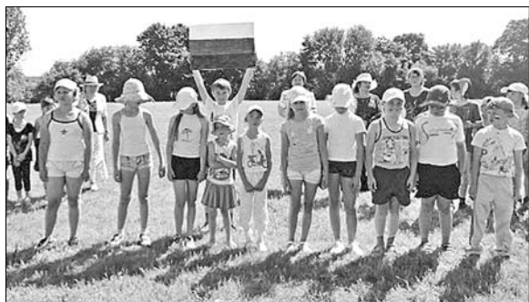
Участники малых олимпийских игр к стартам готовы!