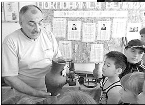
Еще одна экскурсия в школьном музее.