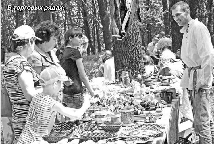
В торговых рядах.

На лесной поляне привольно ребятишкам, к тому же в торговых рядах всегда много такого, что привлекает детский глаз.