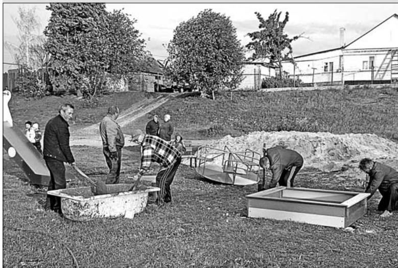
За установку детской площадки жители ул. Школьной принялись дружно и с энтузиазмом.