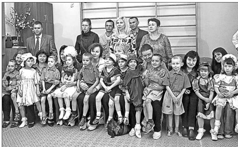
Участники пресс-тура вместе с воспитанниками детского дома № 5 г. Елец.

Каждый воспитанник детского дома имеет свою непростую историю о том, как он оказался здесь. Педагоги стремятся поделиться ду-