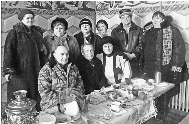
Клуб ветеранов «Сударушка» из с. Малая Боевка.

В каждом селе таких людей хватает. После ухода на пенсию, кроме домашних хлопот и забот о хозяйстве, других занятий-то, по сути, и нет. Если внуки живут рядом, то бабушки и дедушки с удовольствием посвящают себя воспитанию малышей. Но не каждому выпадает такая возможность.