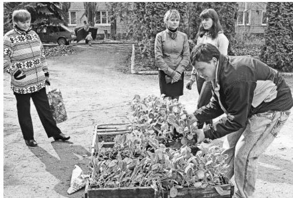
Рассада капусты пользуется спросом.