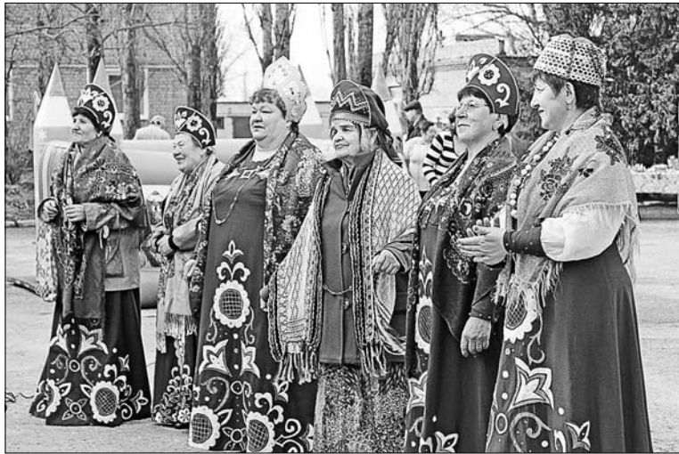
Выступление самодеятельных артистов.

Как всегда, порадовал своими песнями коллектив клуба ветеранов «Лавские сударушки», самодеятельные молодые артисты. Со своей программой сюда приехал народный ансамбль «Околица». Немало было желающих проехаться с ветерком в карете, верхом на