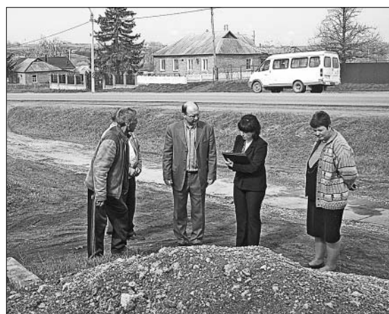
Комиссия составляет административный протокол.

организаций, будь то специалисты администраций сельских поселений или коллективы местных школ, стараются содержать территории в порядке, то некоторые граждане не относятся к чистоте личных подворий, мягко говоря, спустя рукава. В связи с этим начались ежегодные межведомственные профилактические мероприятия, проводимые специалистами администрации Елецкого района