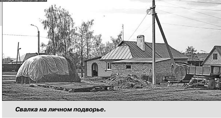
Свалка на личном подворье.

организаций, будь то специалисты администраций сельских поселений или коллективы местных школ, стараются содержать территории в порядке, то некоторые граждане не относятся к чистоте личных подворий, мягко говоря, спустя рукава. В связи с этим начались ежегодные межведомственные профилактические мероприятия, проводимые специалистами администрации Елецкого района