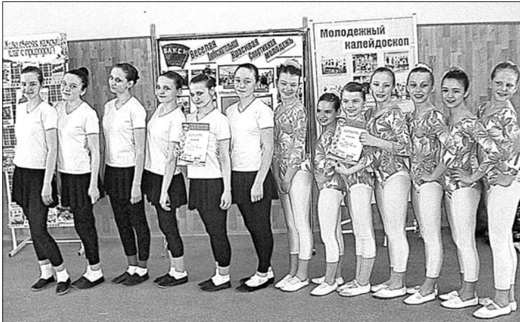
Команды-победительницы зональных соревнований по фитнес-аэробике из школ п. Солидарность и Казацкой № 2.