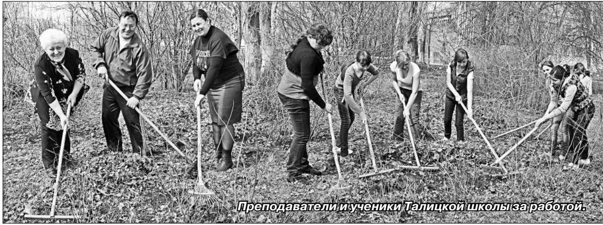
Преподаватели и ученики Талицкой школы за работой.

В эти дни все селяне активно приводят в порядок свои приусадебные участки. Не осталась в стороне и Талицкая школа. Здесь