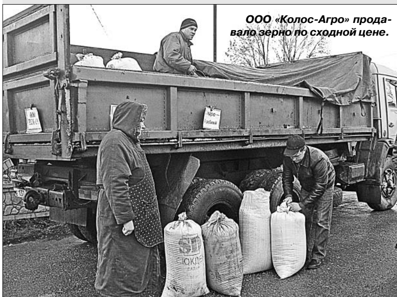
ООО «Колос-Агро» продавало зерно по сходной цене.