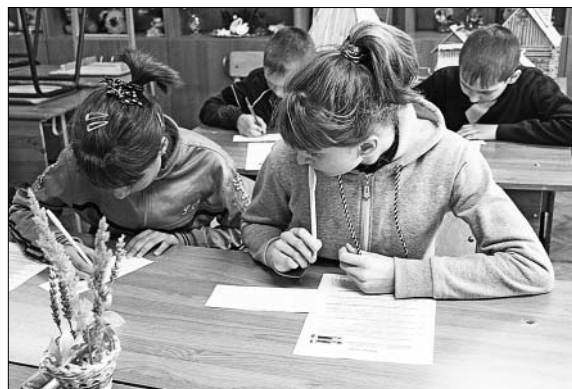
Проверка знаний по оказанию первой помощи.