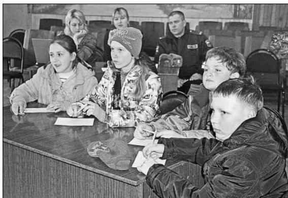
«Экзамен» по ПДД ребята сдали успешно.