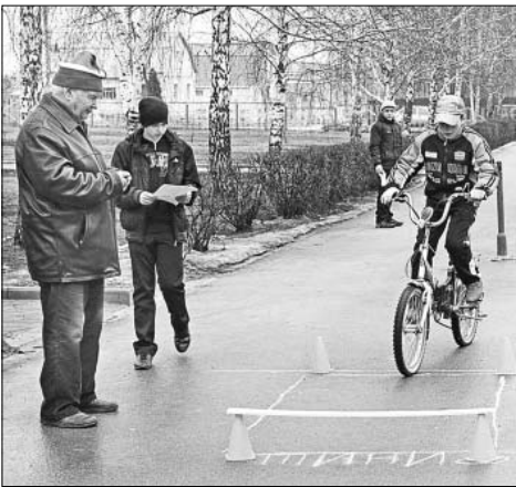
Фигурное вождение двухколесного «транспорта» специальной подготовки требует.

При содействии сотрудников ОГИБДД ОМВД по Елецкому району подготовила А. МИТУСОВА.